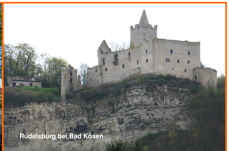
Rudelsburg bei Bad Kösen